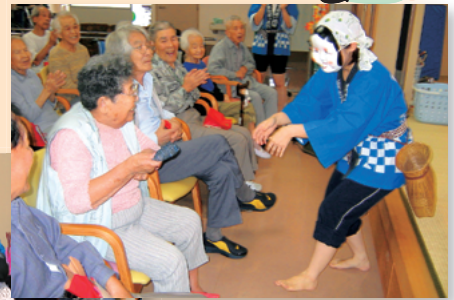
〈敬老週間イベント〉