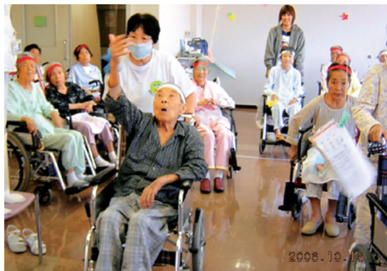
10月 運動会のひっぱり競争