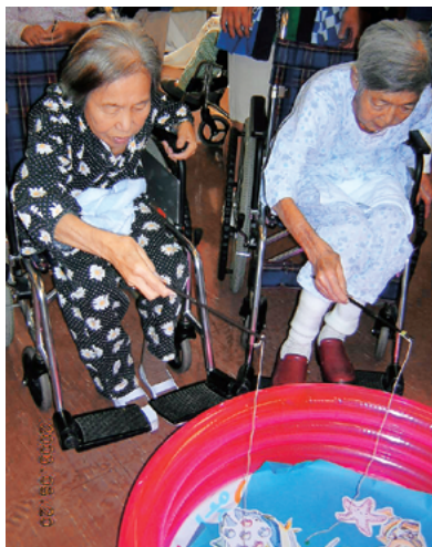
8月 夏祭りの金魚すくい

透析をされている患者様が多い中で、透析のない日曜日に開催することで、患者様全員に参加していただいています。季節にあったレクリエーションをスタッフ全員で考え、患者様と一緒にスタッフも盛り上がり笑顔いっぱいの時間を過ごしています。今後も楽しい企画を考えていきたいと思えます。