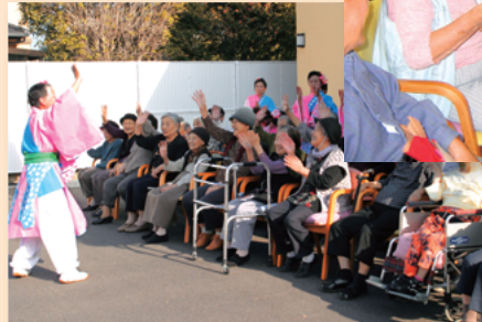
〈AAA 瑞穂の皆さんとの地域交流〉