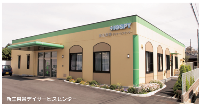
新生楽舎デイサービスセンター

#HOOPY #HOOPY #HOOPY #HOOPY #HOOPY #HOOPY #HOOPY