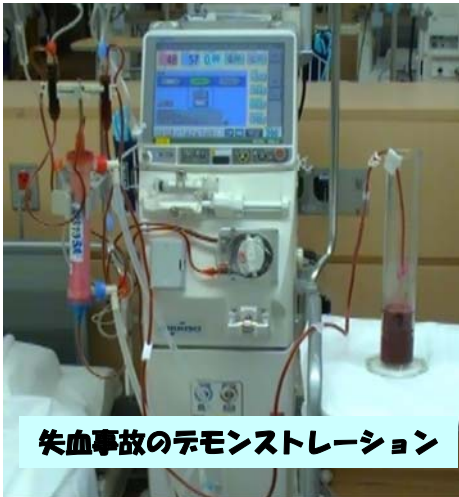
失血事故のデモンストレーション

失血とは、透析中に血液回路やダイアライザーに亀裂が入る、血液回路とダイアライザーや穿刺針との接続部が外れる、穿刺針が抜ける、などの原因によって出血することをいいます。出血量が多い場合は重篤な状態となるため、失血を最小限にするよう異常の早期発見、迅速な対応が大切です。