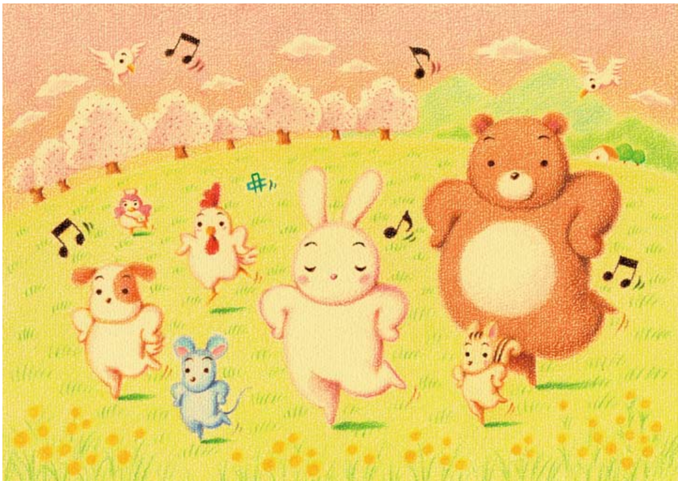
イラスト / はせがわゆらじ