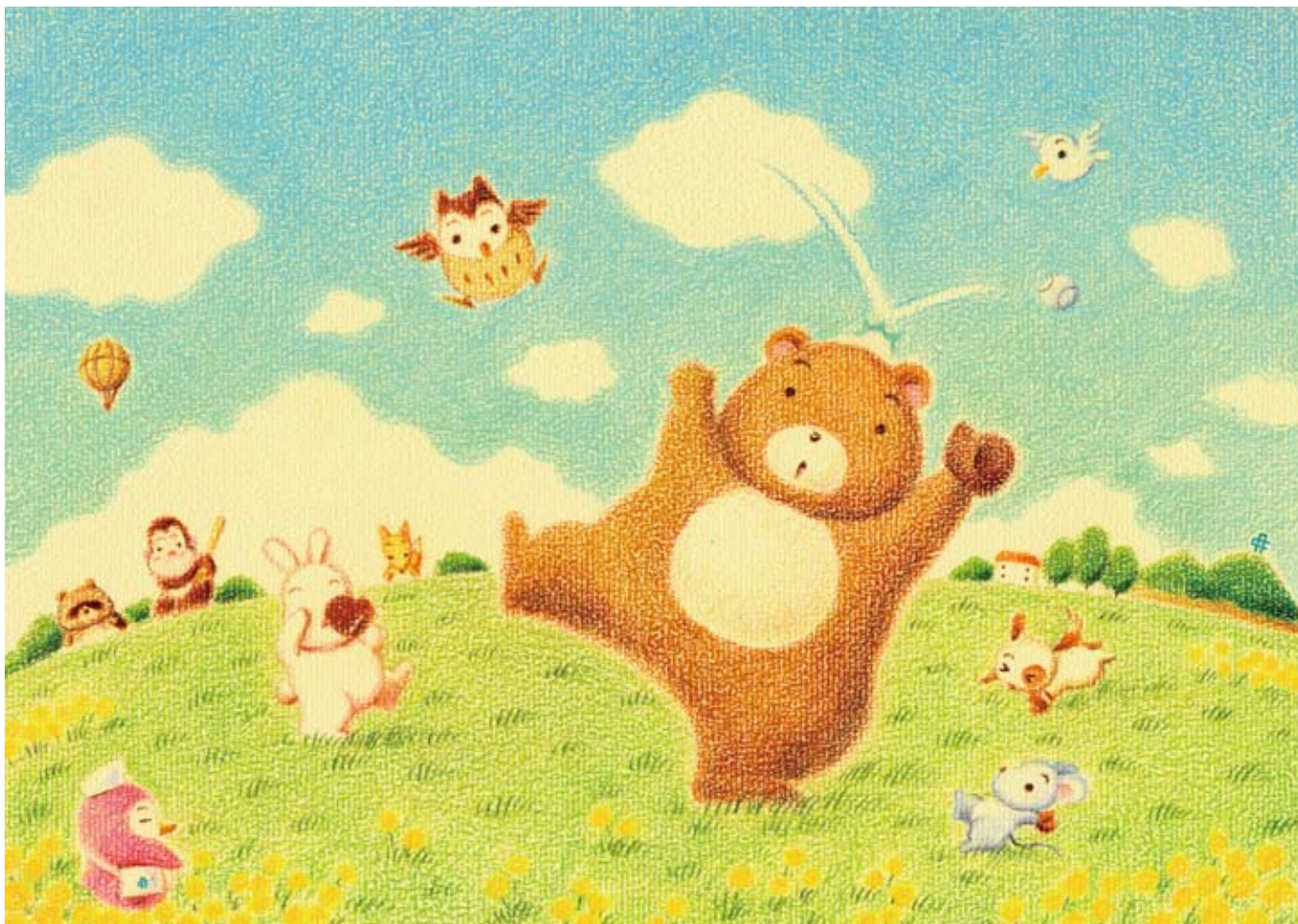
イラスト / はせがわゆづり