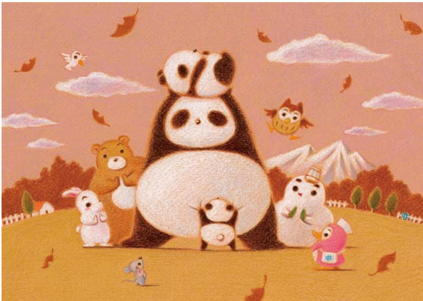
イラスト / はせがわゆうじ