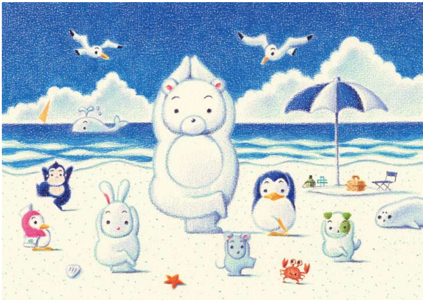
イラスト / はせがわゆうじ