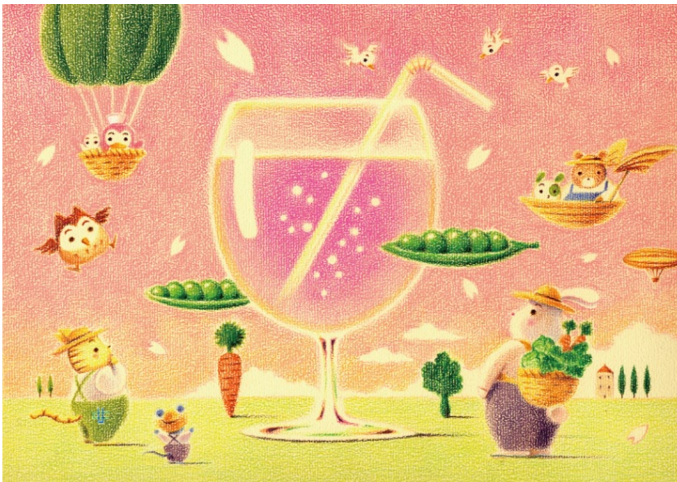
イラスト / はせがわゆうじ