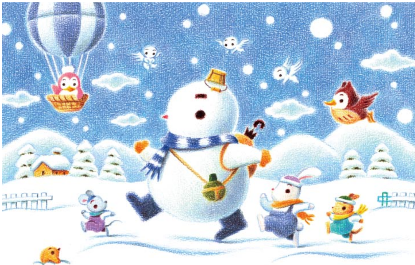
イラスト / はせがわゆうじ