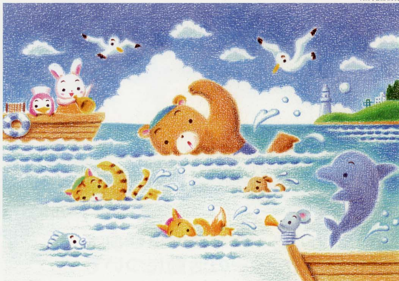
イラスト / はせがわゆうじ