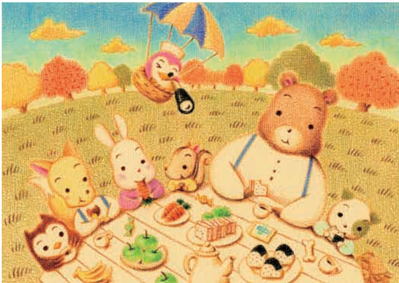
イラスト / はせがわゆうじ