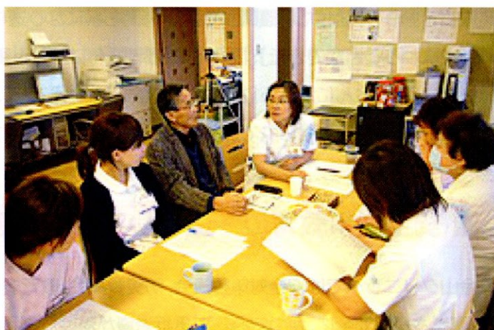
長期透析患者さんよりセルフケアを学ぶ

「長期透析患者さんから学ぶ」学習会にお越しいただく患者さんの選択にあたっては、普段から看護師とのコミュニケーションが良好で、教師を勤められた方など人前で話すことが苦手ではない患者さんに依頼しているという。第1回の学習会では、長期透析患者さん1名を招いて、これまでの透析生活での体験談を語っていただき、その患者さんの奥様も交えて参加者全員でディスカッションを行った。第2回はさらに活発なディスカッションを期待して、3名の長期透析患者さんを招いて、3つのグループに分かれて、透析治療に対する思い、自己管理のポイント、医療者側に求めることなどについて、自由に意見交換を行った。